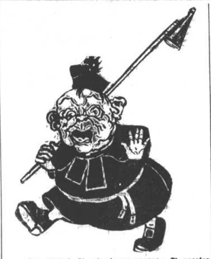
— Que diabo! Já não temos socogo. E' preciso apagar a lux dessa infernal LANTERNA, que não nos deixa em paz.